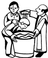
Christian Initiation of Adults